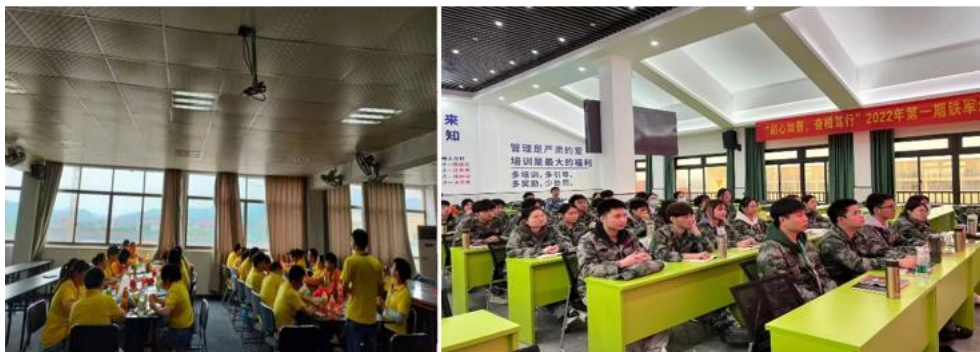
图 3.2-1 各类培训活动

经公司领导审批，相关部门每季度根据人员数量酌情进行培训计划的制定与实施。公司并成立了““康巴赫”商学院”，见图 3.2-1 所示。