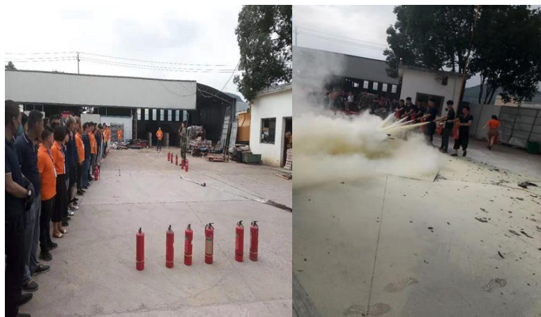
图 6.3-01 消防演练现场

公司每年举行消防演练和各种灾害应急演练。公司制订了《配电房火灾、爆炸应急预案》等应急预案、《触电事件应急预案》、《重大设备故障应急预案》等应急处置方案等，对火灾、机械、触电等均有相应的应急措施，并成立了应急指挥中心和应急救援专业组。